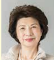
学校法人 福原学園 理事長 同窓会「梅香会」顧問