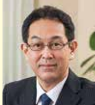
九州女子大学・ 九州女子短期大学 学長