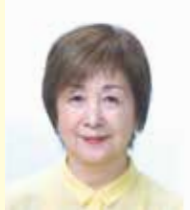
梅香会 会長 S53 年体育科 H29 年度人間基礎学専攻科