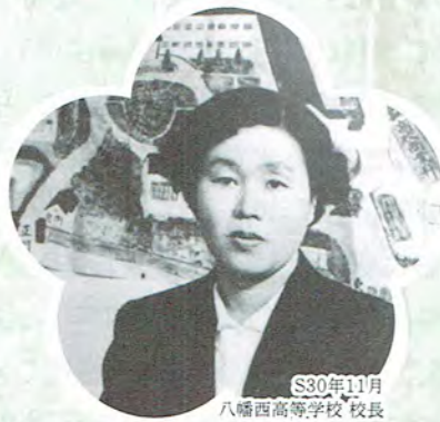
S30年11月 八幡西高等学校 校長