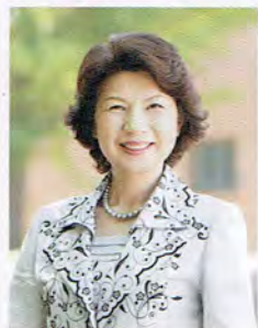
学校法人 福原学園 理事長 九州女子大学・九州女子短期大学 学長 同窓会「梅香会」 顧問