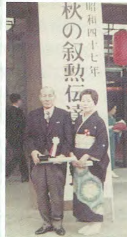
S47年 勲三等旭日中授章受章