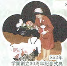
S52年 学園創立30周年記念式典