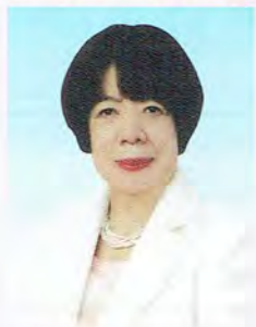
梅香会 会長 S47年度 短大音楽科卒