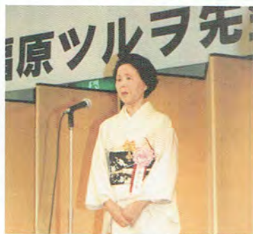
H13年1月 勲四等宝冠章受章祝賀会